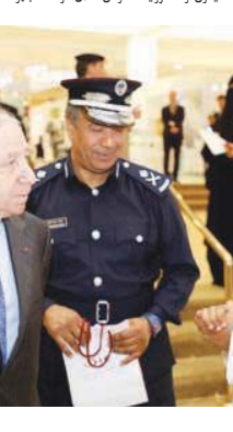
خلال المشاركة بالحدث

ومن خلال التطبيق سيتمكن العملاء من الحصول على جميع الخدمات والمزايا لرصيد سويتك من خلال مؤشر القيادة الآمنة على الطرق. تم تصميم البرنامج وفقاً لآراء معايير تطبيق البنك الإصطناعي، والذي يهدف إلى المساعدة في تطبيق المعايير التي حدتها رؤية قطر لتأمين في إطار المسؤولية الاجتماعية من خلال العمل على تخفيض عدد الحوادث المرورية بنسبة كبيرة. كما شاركت قطر لتأمين في إجراء العديد من الاستطلاعات لتطوير تقارير مراقبة RoadSafe التي تبرز أخطاء القيادة لسنائي السيارات والمجال الرئيسية لتعزيز السلامة على الطرق لجميع المستخدمين. ومن خلال مواصلة جهودها مع المرحلة الثانية من خطة التفتيش