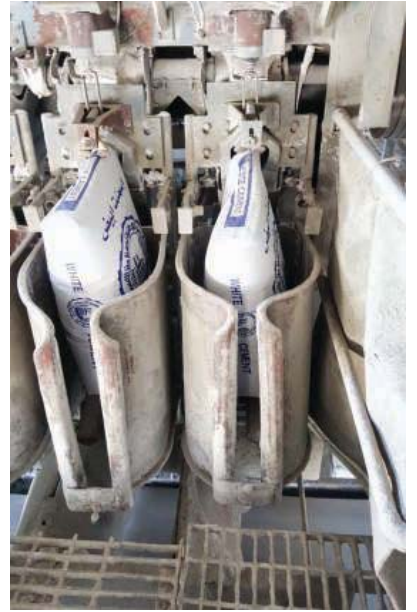
خط عملية الإنتاج بالمصنع

أعلنت شركة قطر الوطنية لصناعة الأسمت، عن إنتاج الأسمت الأبيض بعد أن حصلت على التراخيص اللازمة للمنتج، ويتوفر المنتج في عبوات زنة 50 كيلو جراما بسعر 25 ريال للطن، كما يتوفر المنتج بالسائب بسعر 500 ريال للطن، وقال بيان صحفي صادر عن الشركة إن من أهم استخداماته إنتاج الأسمت والحواجز الخاصة بالمعرق وتعطيل الجدران وإزالة برك السباحة والنوافير - ترزم الأثار - صناعة البلاط ويختلف أنواعه وسد الفواصل والفراغات بين حجارة البناء. كانت الشركة قد أعلنت في وقت سابق خلال الشهر الماضي عن إنتاج أسمت خبث الحديد «سلاج» لتلبية لاحتياجات الدولة من المادة وتحقيقا للاقتصاد الذي تتماشى مع رؤية قطر 2030. الجدير بالذكر أن الشركة حصلت على شهادات الأيزو في نظام الإدارة للتكامل والبيئة والصحة والسلامة المهنية (ISO - OHSAS 18001:2007 - ISO 9001:2015). يذكر أن الشركة قد أعلنت في أبريل الماضي أن اختيارات أداء لطاقتها الأسمت، اصنع الأسمت رقم (5) اكتسبت بنجاح وتم الاستلام الإبداعي لطاقتها من الممول للشركتين، بطاقة تصميمية تزيد على 5 ألف طن أسمت في اليوم، كما أعلنت شركة قطر الوطنية لصناعة الأسمت في شهر يونيو الماضي عن