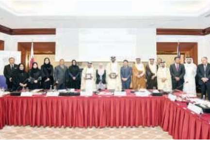
صورة جماعية لمسؤولي الجانبين

رابطة رجال الأعمال تلقي نائبة رئيس الوزراء تعزيز التعاون القطري - الماليزي